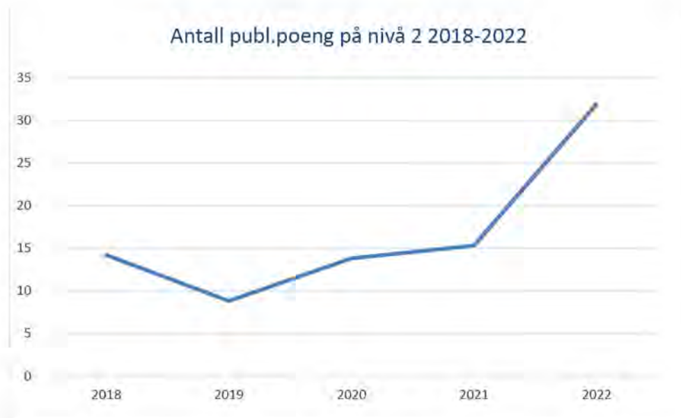
Figur 1. Antall publikasjonspoeng på nivå 2, 2018-2022

En av SNFs PhD-kandidater disputerte 13. september, og en annen leverte avhandlingen i oktober 2022 og disputerte 21. februar 2023.