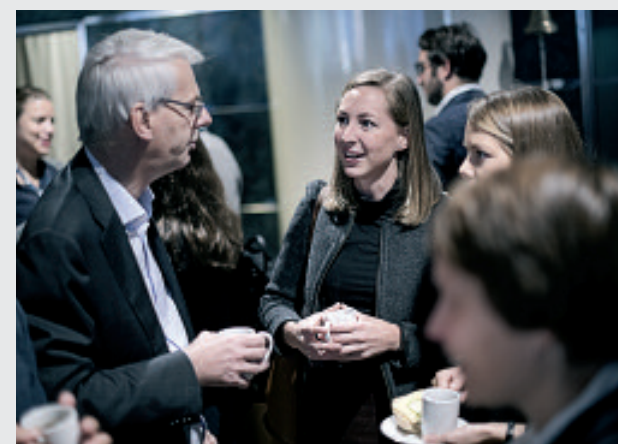
MINGLING MED REKTOR.