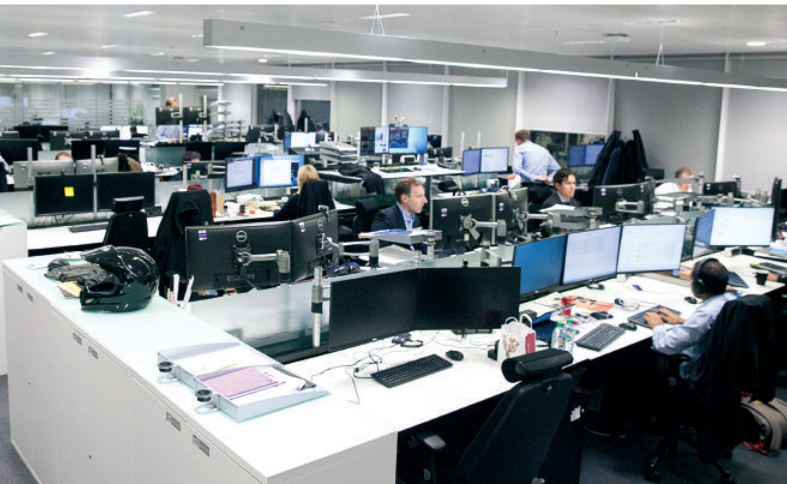
FORVALTERE OG TALLKNUSERE I STILLE ARBEID I KONTORENE I QUEENSBERRY HOUSE, ET STEINKAST UNNA REGENT STREET.