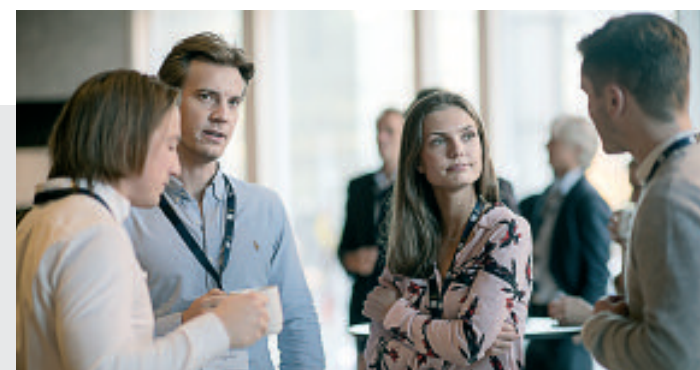
SAMTALE OVER EN KAFFEKOPP.