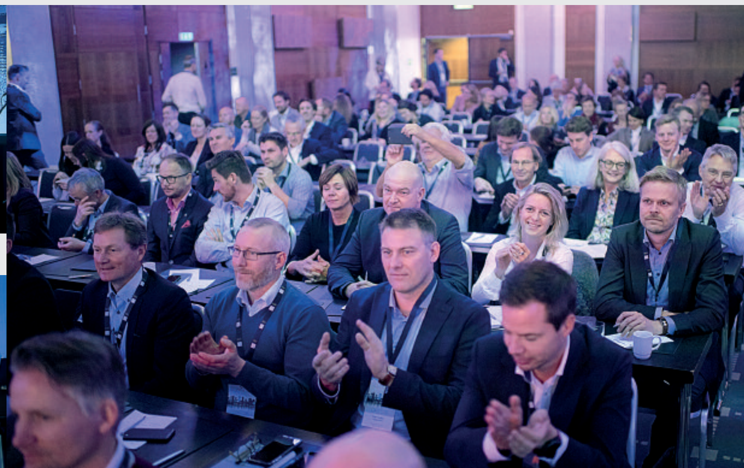
OPPTUR SAMLET OVER 500 NHH-ALUMNI.