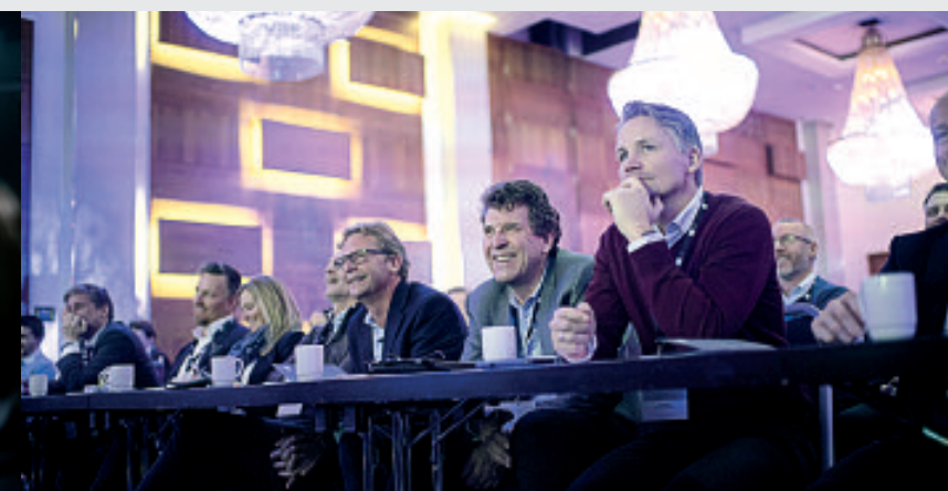
GOD STEMNING BLANT DELTAKERNE.