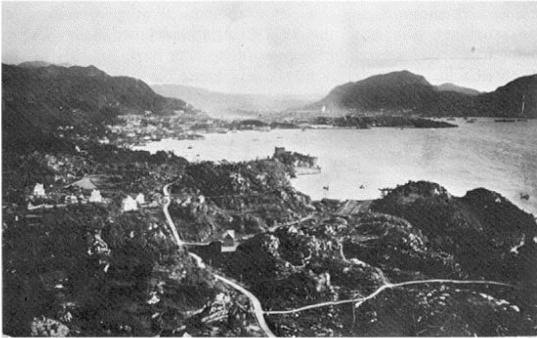
Breviksen (der NHH i dag er plassert) slik det så ut rundt 1920.