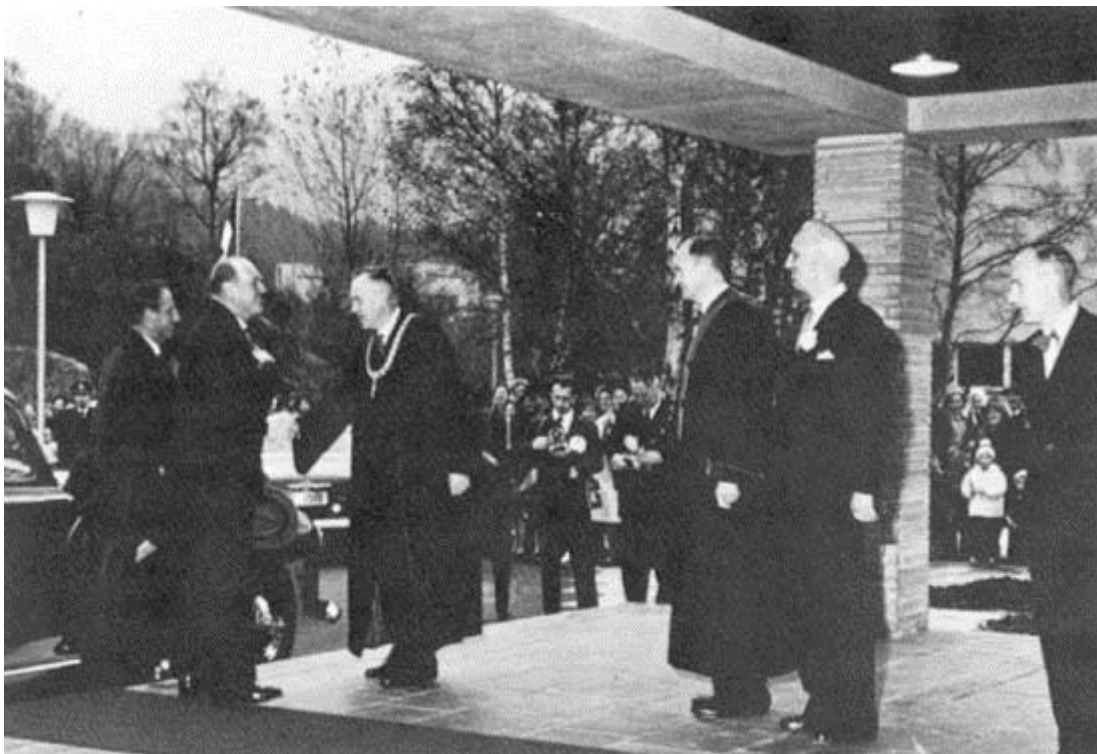
Rektor Waaler ønsker Kong Olav V og Kronprins Harald velkommen til den offisielle åpningen av NHHs nye skoleområde 28. oktober 1963.

Mot slutten av 1950-årene var NHH blitt for stor for de opprinnelige lokalitetene og arbeidet med å forme et nytt skoleområde i Breiviken, rett utenfor Bergen sentrum, startet. I 1963 flyttet skolen til sin nye campus, en begivenhet som på mange måter markerte overgangen til en ny periode karakterisert av rask vekst i antall studenter så vel som i faglig stab. Fasilitetene på det nye området innebar nemlig en stor kapasitetsøkning og det årlige opptaket av studenter økte fra 60 til over 200. Totalt var det nå 304 studenter og 67 ansatte.