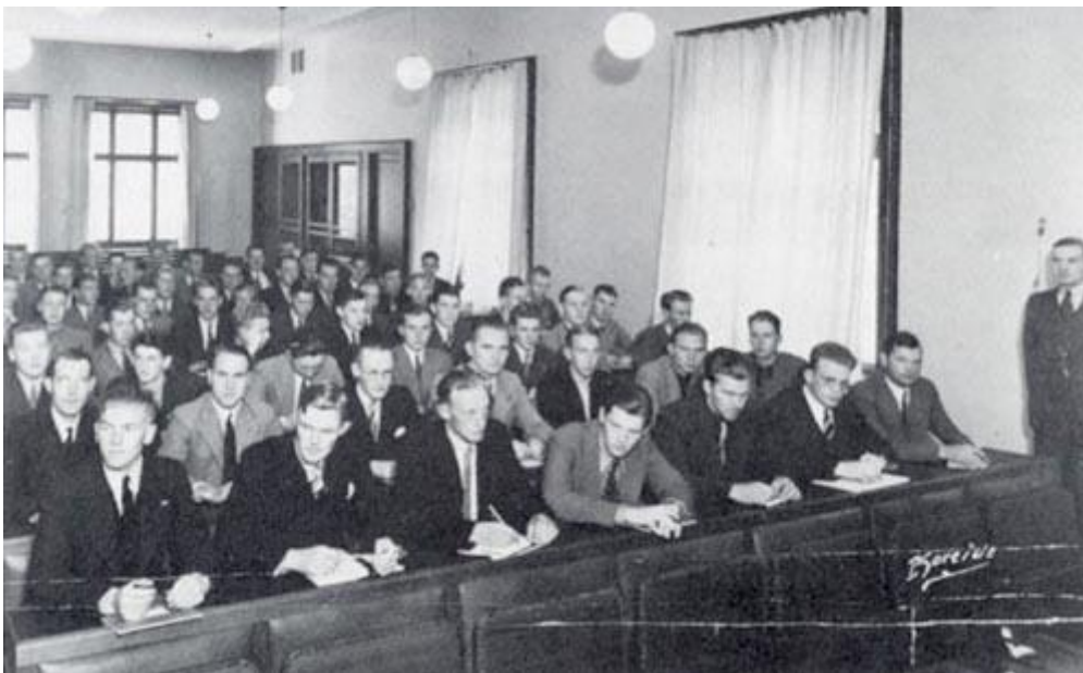
Den første forelesningen ved NHH, 1936.

Da NHH åpnet var den faglige staben på under ti personer og 60 studenter ble tatt opp hvert år. Etter to års studier mot Handelsdiplomet kunne kandidatene titulere seg som Handelskandidat. I 1938 ble det i tillegg opprettet en ettårig videreutdanning for dem som ønsket å undervise i handelsfag. Som ved de andre skandinaviske handelshøyskolene på denne tiden var undervisningsopplegget sterkt preget av den tyske modellen for handelsutdanning. Økonomi og administrasjon var sentralt i pensum og studentene måtte velge enten jus, økonomisk geografi eller økonomisk historie, i tillegg til et fremmedspråk. Fra starten av ble det undervist i engelsk, tysk og fransk, mens spansk kom til som eget fag i 1952. I 1946 ble Handelsdiplomutdanningen utvidet til tre år.