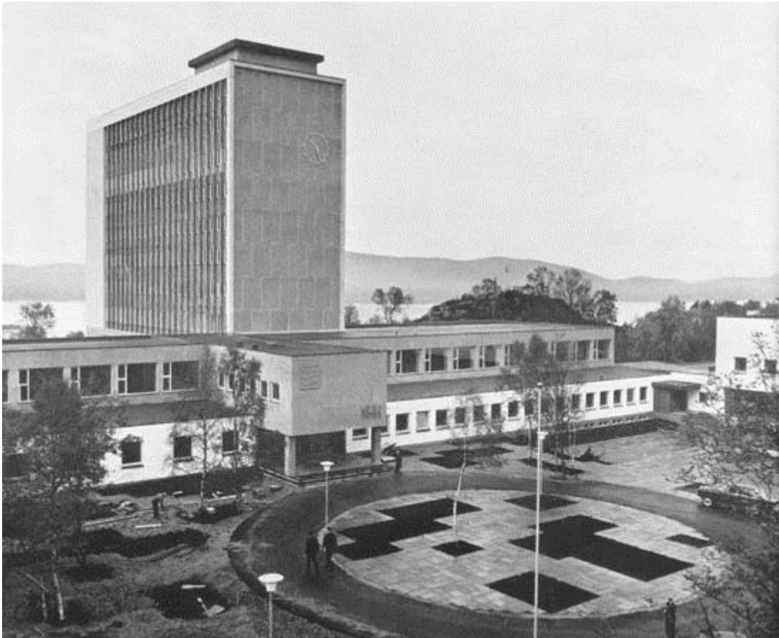
Det nye skoleområdet i 1963.

mens andre igjen, som Kydland, returnerte til NHH for senere å dra tilbake til USA for å fortsette arbeidet der.