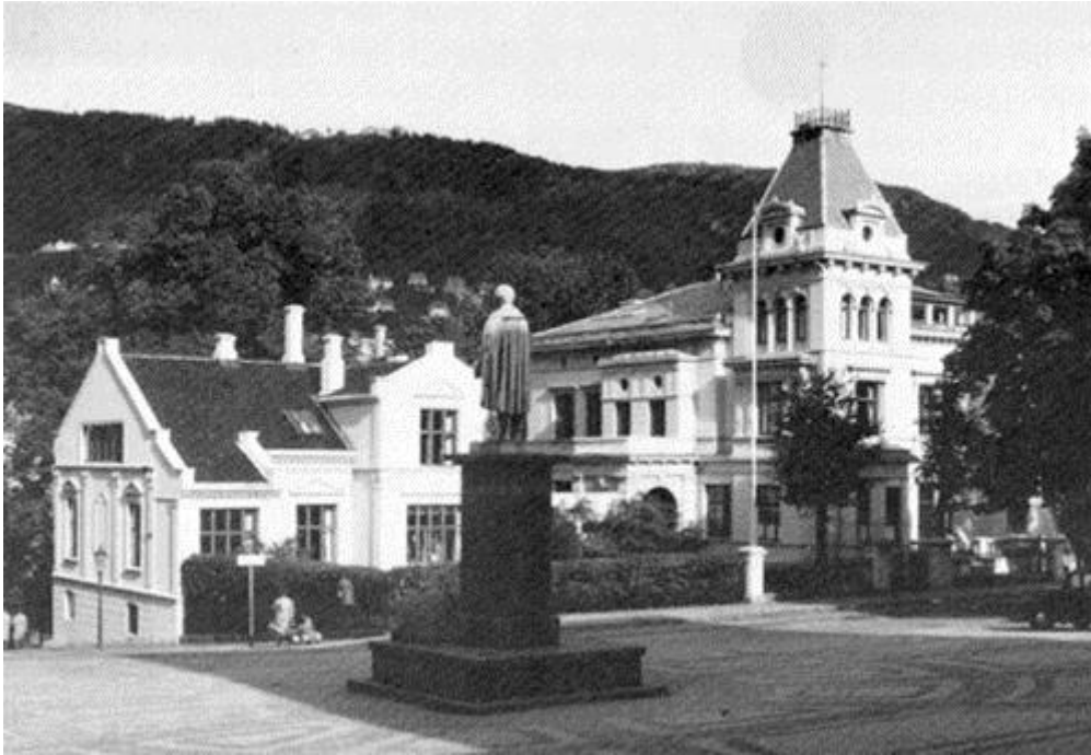
NHHs opprinnelige bygning i Christies gate i 1936.