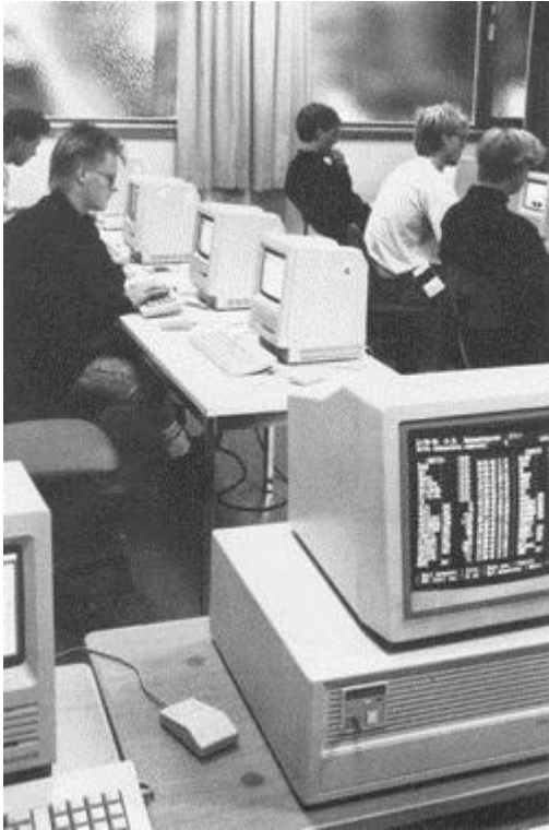
"Moderne" PC-utstyr i 1985.

I 1984 ble SAF organisert som en separat forskningsstiftelse og i 1986 ble Centre for International Business (CIB) grunnlagt. SAF, IØI og CIB ble slått sammen til en forskningsstiftelse, Samfunns- og næringslivsforskning (SNF) i 1991. SNF er tilknyttet NHH som en markedsbasert forskningsorganisasjon.