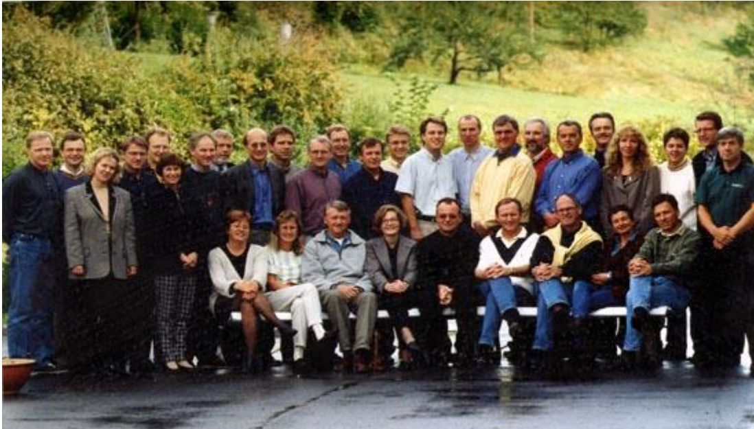
Den første klassen i det nye EMBA i Strategisk Ledelse, MASTRA I, 1996

I 1996 ble et Executive MBA program (EMBA) med spesialisering i strategisk ledelse, MASTRA, etablert. Dette programmet var en naturlig utvikling og utvidelse av arbeidet NHHK hadde lagt ned i å promotere videre- og etterutdanning siden 1950-årene. Det toårige deltidsprogrammet gjorde suksess og nye spesialiseringer har senere kommet til. Disse programmene bygger alle på den akademiske kompetansen på NHH og kombineres med den erfaringen som er hentet inn fra tidligere spesialiserte deltidskurs for deltakere fra næringsliv og offentlig administrasjon som ikke har anledning til å ta fulltidsutdanning, men like fullt har et ønske om å lære.