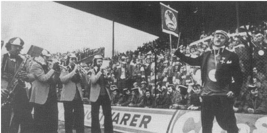
Direksjonsmusikken på Ullevål i forbindelse med cupfinalen i 1976.

1960- og 70-årene var en aktiv tid også i NHHS. Som i de fleste deler av den vestlige verden ble politikk en viktig del av studentlivet også på NHH, men studentene beholdt også sitt fokus på sosiale og nettverksskapende aktiviteter.