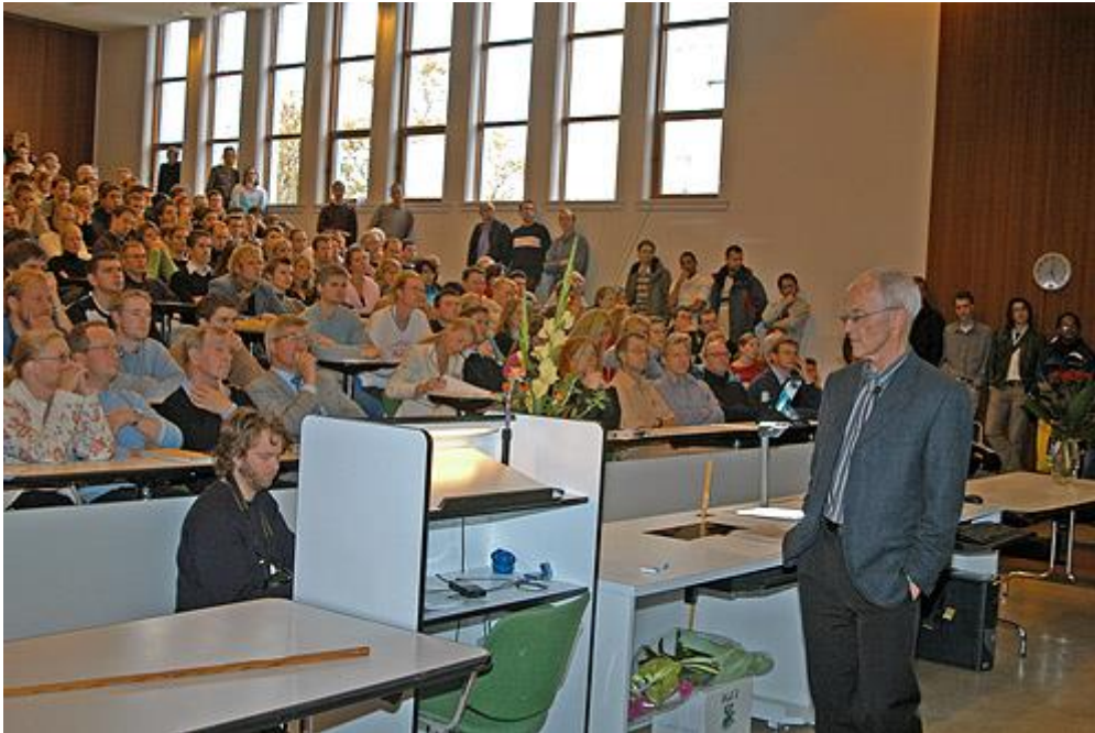
Nobelprisvinner Finn E. Kydland holder en spesialforelesning foran et fullstappet auditorium 12. oktober 2004

I 2004 fikk den tidligere studenten og nå professor 2 ved NHH, Finn E. Kydland Nobelprisen i økonomi sammen med professor Edward C. Prescott fra Arizona State University.