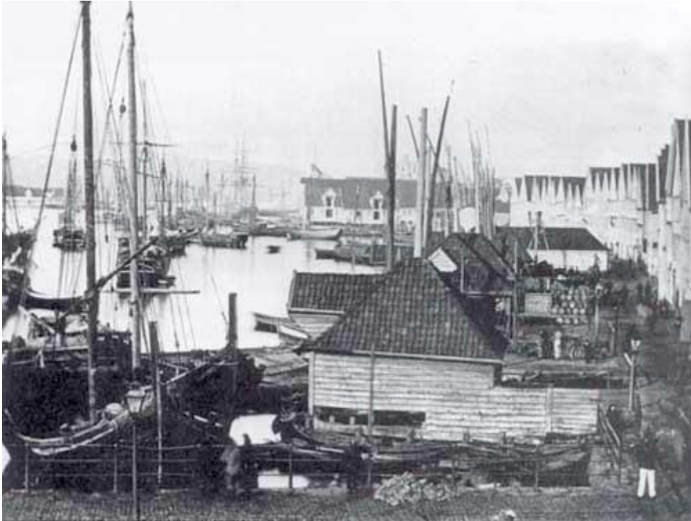
Bergen på slutten av 1800-tallet.

Den bergenske handelsstanden hadde fra slutten av 1800-tallet støttet ideen om å starte en handelshøyskole i Bergen. I 1900 opprettet Bergen Handelsforening en komité for å vurdere etableringen av et handelsgymnas i byen. Fire år senere ble Bergen Handelsgymnasium grunnlagt.