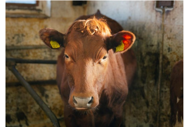
TINEs Kukraft-prosjekt: Kumøkkbasert biogass. Biorest brukes til gjødsel