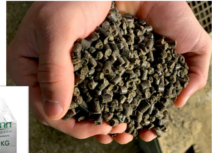
Bærekraftig gjødsel basert på rester fra fjørfeproduksjon og fiskeslam